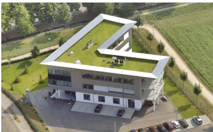
AKG Stammsitz: Heitersheim

Seit über 35 Jahren steht die AKG-Firmengruppe für innovative Planungssoftware im Bereich Hoch- und Tiefbau. Das Unternehmen beschäftigt über 80 Mitarbeitende an sechs Standorten und besteht aus fünf Gesellschaften. Die AKG Software Consulting GmbH ist spezialisiert auf Softwarelösungen für den Tiefbau-Sektor, während die AKG Civil Solutions GmbH als Autodesk-Vertragshändler ihren Fokus im Bereich Infrastrukturplanung von Hoch- und Tiefbauten hat. Wenn es um Dienstleistungen im Bereich Grunderwerb und Liegenschaftsverwaltung geht, ist die AKG Bauconsult GmbH ein ebenso zuverlässiger wie bewährter Partner. In Österreich ist die AKG Software Austria GmbH zuständig für den lokalen Vertrieb, für Schulungen und Kundensupport. Die gleichen Aufgaben übernimmt die AKG Software Schweiz GmbH im Nachbarland. Zur internationalen Kundschaft in unterschiedlichen Branchensegmenten zählen kleine und große Ingenieurbüros, öffentliche Institutionen sowie Bauunternehmen.